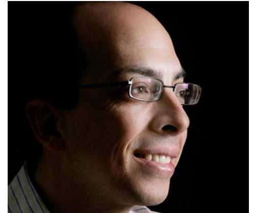
Jorge Volpi, tercer mexicano en obtener el Premio Alfaguara de novela.

La suma del premio, dotado con 175 mil dólares, lo quiere destinar, según adelantó, para contri-