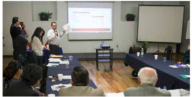
Con gran entusiasmo, los alumnos expusieron lo aprendido a lo largo del diplomado.

conformación de actividades académicas como ésta, demuestra que la colaboración entre las instituciones públicas y la iniciativa privada puede rendir frutos muy satisfactorios. La plantilla docente, además de que domina la teoría, está activa en la industria; “esto nos permite estructurar minuciosamente el programa académico, lo que beneficia a los participantes, al mismo tiempo que brinda la oportunidad de adquirir conocimientos útiles en la labor de trabajo cotidiano”, señaló.