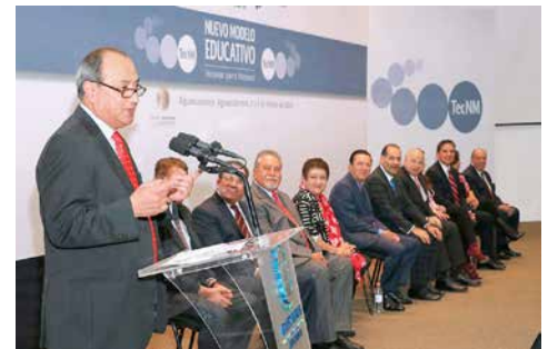
Otto Granados, secretario de Educación Pública.

Luego, en la Reunión Nacional de Directoras y Directores del Tecnológico Nacional de México, el secretario Granados Roldán dijo que esa institución se ha convertido en una fuerza robusta en la educación superior, con 254 instituciones que generan casi la mitad de los ingenieros en México, con casi 600 mil estudiantes, además de que genera solicitudes de registros de patente y artículos académicos.