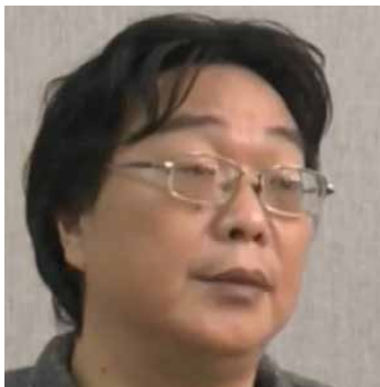
Gui Minhai.

El galardonado ha contribuido a la libre circulación de ideas, participando en conferencias sobre derechos humanos y formando parte de la junta de la organización independiente de escritores, PEN, en China.